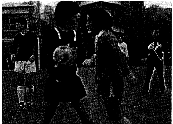
練習試合風景 (平成5年)