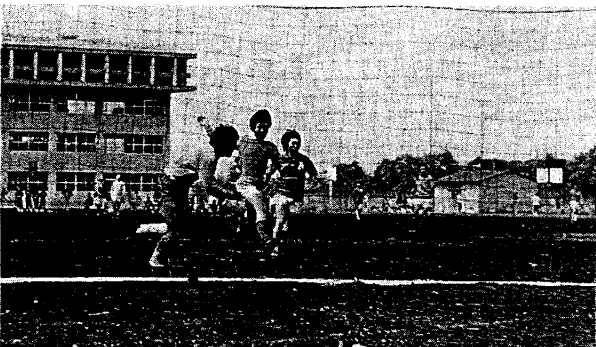
スポーツ都市宣言記念大会 (昭和51年)