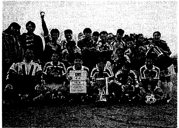
天皇杯県南予選優勝風景 (平成8年)