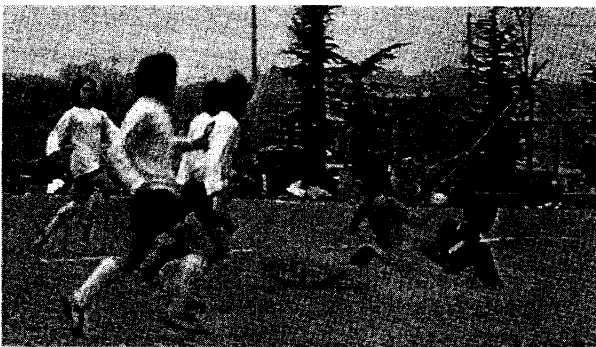
サッカー大会風景 (昭和48年)