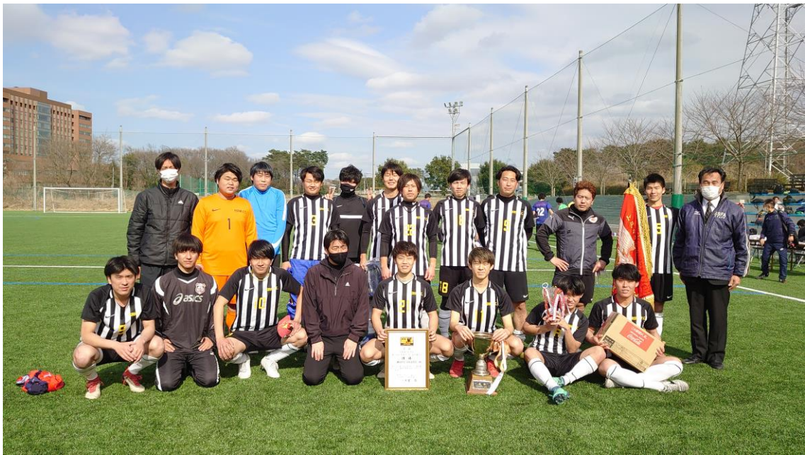
上尾市サッカー選手権大会 過去の優勝チーム